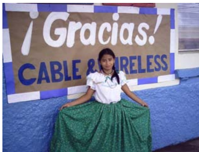
Escuela José D. Carrizo